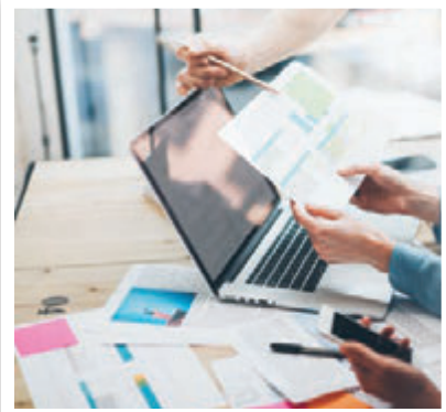
MÜŞTERİ VERİTABANIMIZLA PAYLAŞIM