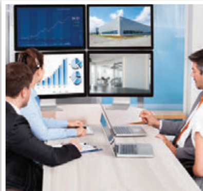
SEKTÖRDEKİ İŞ ORTAKLARIMIZLA PAYLAŞIM