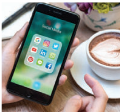
SOSYAL MEDYA TANITIMI