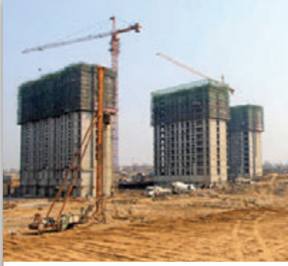
ARAZİDE PROJE GELİŞTİRME