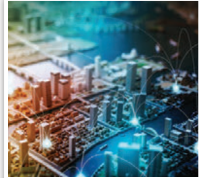
KİRALIK GAYRİMENKULLER İÇİN SEKTÖR UYGUNLUĞU TESPİTİ