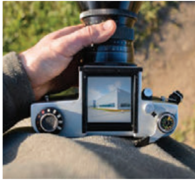
PROFESYONEL FOTOĞRAF ÇEKİMİ