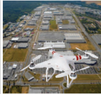
PROFESYONEL 4K DRONE VİDEO ÇEKİMİ